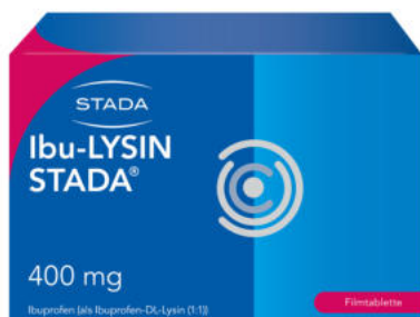
Ibu Lysin Stada