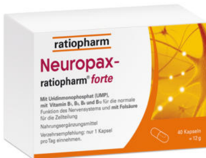
Neuropax ratio forte