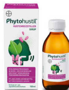
Phytohustil Hustenreizstiller Sirup