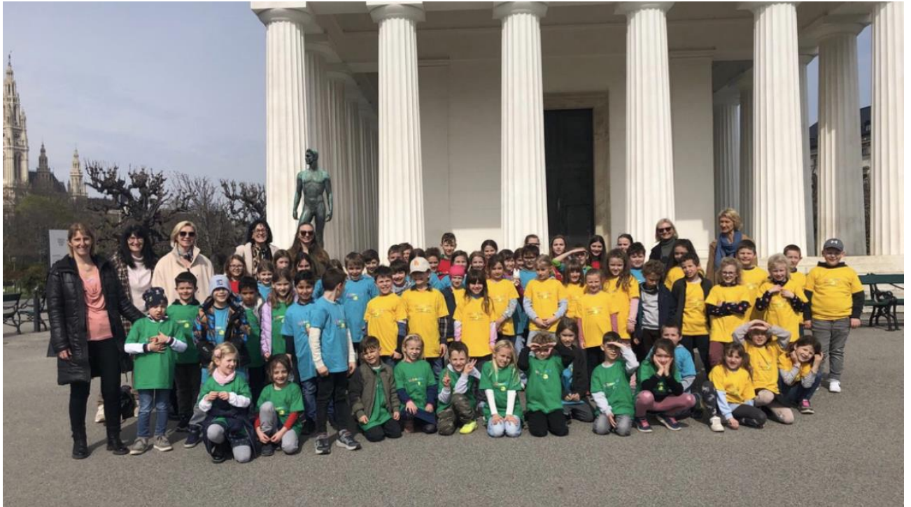
Für die ganze Schule war dieser Wien-Tag etwas ganz Besonderes.