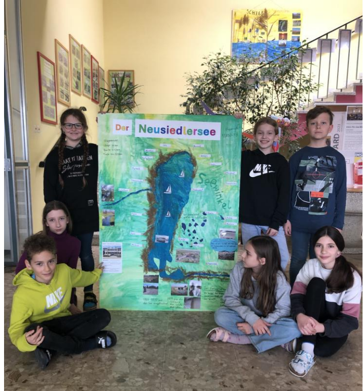
Wandtafel: See und Umgebung