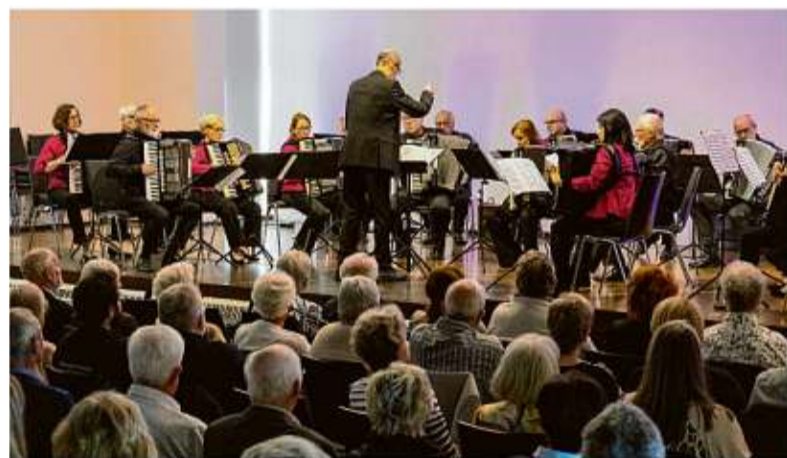
Vielseitig präsentierte sich der Jubilar, das Akkordeon-Orchester Ebersbach, im Credo.