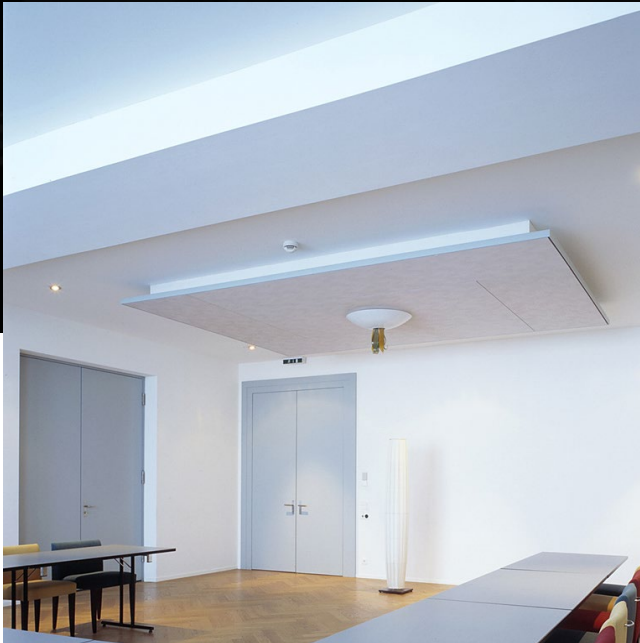
Imagio® S Design, Teilflächen-Deckenbekleidung Park im Grünen, Gurten