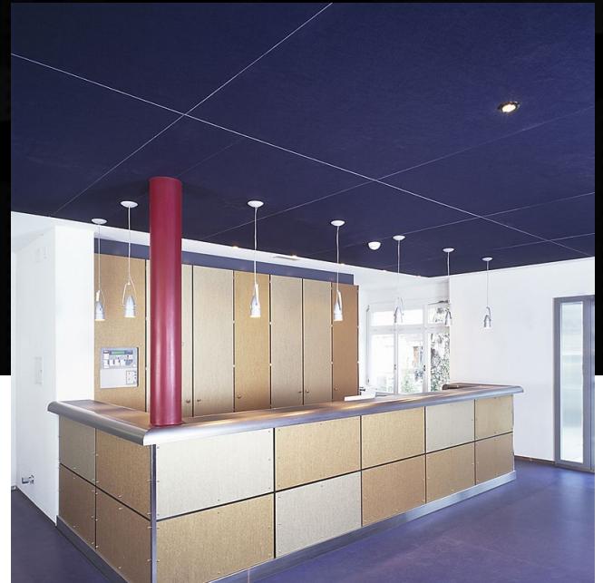
Imagio® S Design, Deckenbekleidung Hotel Lady's First, Zürich