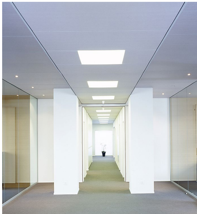
Imagio® S Design, Deckenbekleidung SMS, Zürich

Abwaschbar mit Wasser und synthetischem Schwamm oder Bürste, absaugen mit Staubsauger und Bürste.