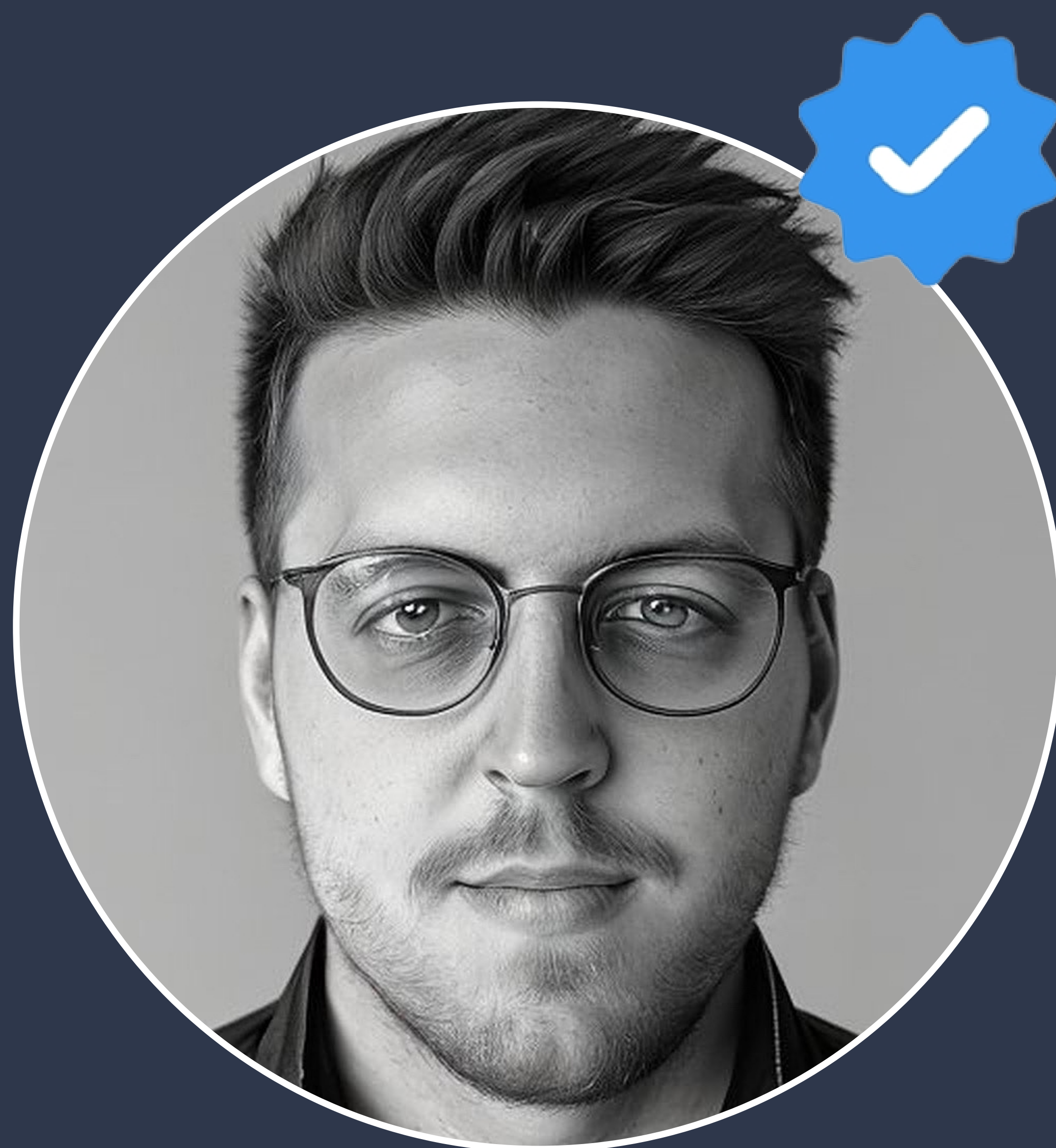
ARNE - BEAMTENHAHN

Keine Angst, du bist nicht alleine! Als kleine Einstimmung zu allgemeinen Fragen und Problemen werden hier(präventiv) einige Anstöße und Tipps fürs Studium gegeben, die dir das Leben erleichtern.