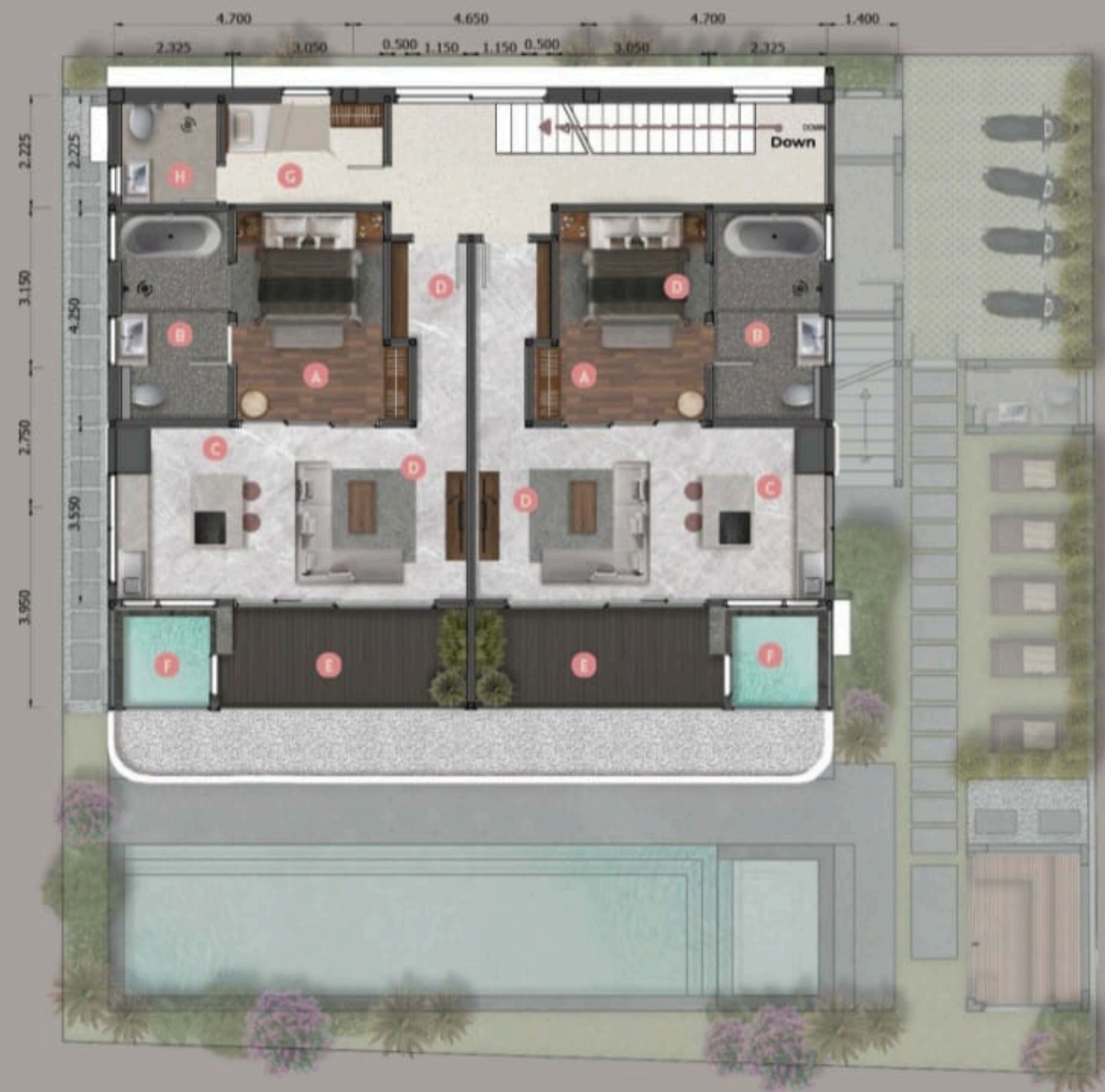
VOLUME SECOND FLOOR 1: 192 M2