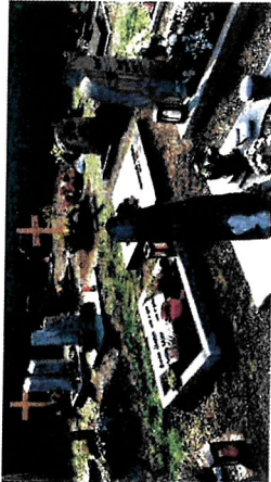
Urnereihen- oder Urnenwahlgräber