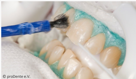
Power-Bleaching beim Zahnarzt: Auftragen des Bleaching-Gels

Wenn Sie die Praxis wieder verlassen, können Sie sich an sichtbar helleren Zähnen freuen!