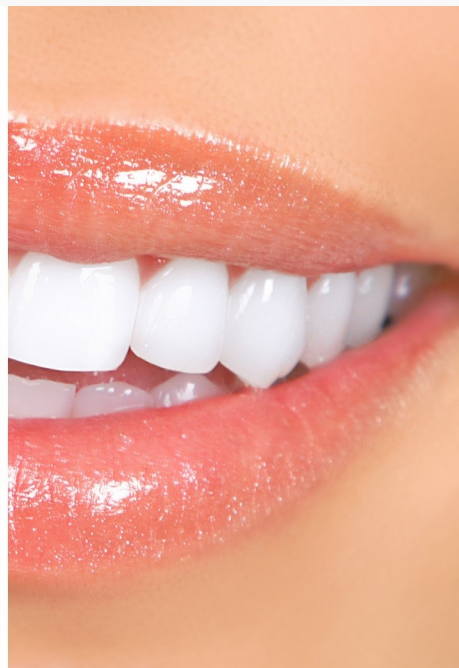
Deutlicher Unterschied: Professionelles Bleaching beim Zahnarzt wirkt!