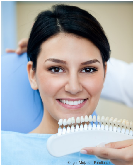
Bleaching vom Zahnarzt: Gewinnendes Lächeln mit strahlend weißen Zähnen

Professionelle Zahnaufhellung durch den Zahnarzt