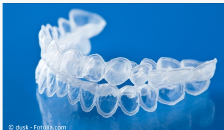
Bleaching-Form aus Kunststoff, in die Sie das Aufhellungs-Gel einfüllen.

Beim Home-Bleaching werden vom Zahnarzt dünne flexible Formen aus einem transparenten Kunststoff hergestellt, die genau auf Ihre Zähne passen (siehe Foto).