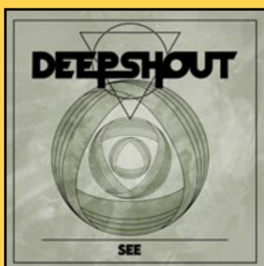
SINGLE «SEE» (2024)