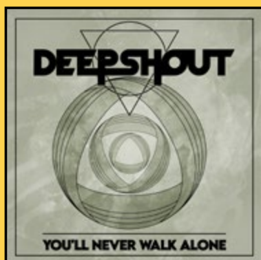
SINGLE «YNWA» (2024)