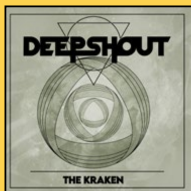
SINGLE «THE KRAKEN» (2025)