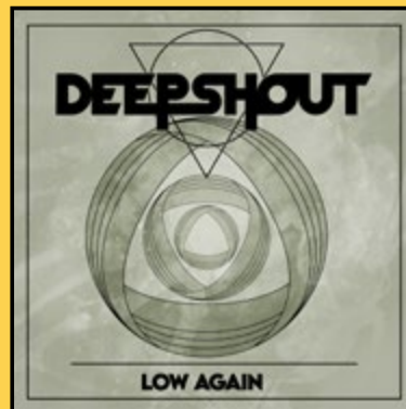
SINGLE «LOW AGAIN» (2025)