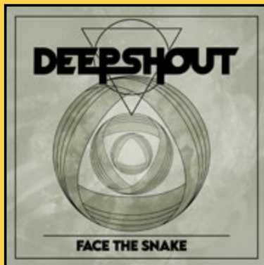
SINGLE «FACE THE SNAKE» (2025)