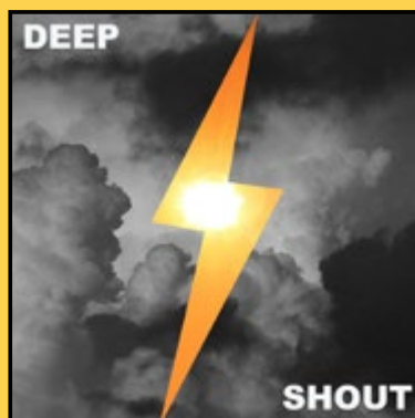
EP «LIGHT AND SHADOWS» (2023)