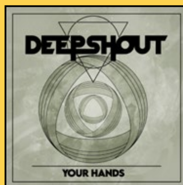
SINGLE «YOUR HANDS» (2025)