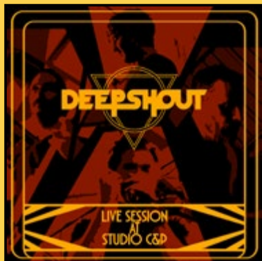
«LIVE SESSION AT C&P STUDIO» (2026)