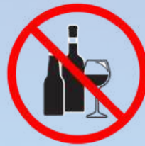
PET-, ALU- & Glasbehälter