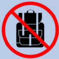
Rucksäcke & Taschen größer als DIN A4