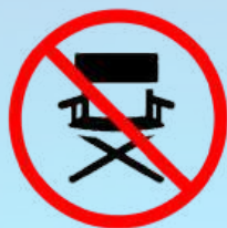
Campingstühle & Campingzubehör