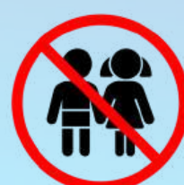
Kinder unter 18