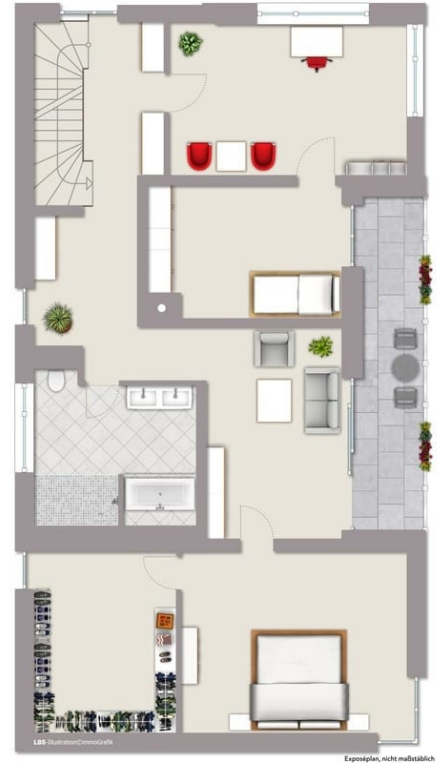
Grundriss 1. Obergeschoss