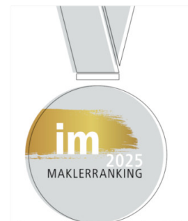
* laut immobilienmanager, Ausgabe #5/2025, ist die S-Finanzgruppe „Deutschlands größter Makler für Wohnimmobilien“

Nutzen Sie unsere ausgezeichnete Qualität: