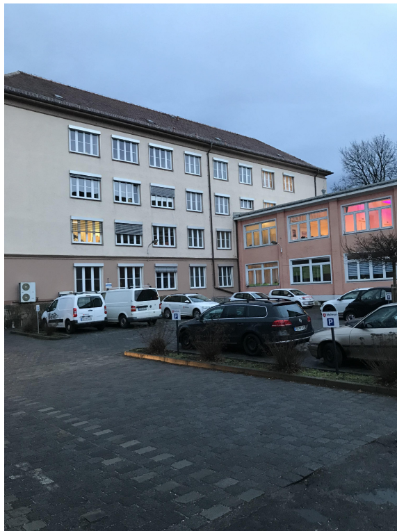
Rückansicht Vordergebäude und Zwischenbau