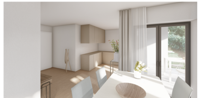
Kochen / Essen