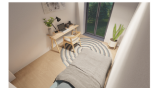
Arbeiten / Gast