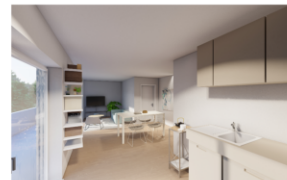
Küche / Essen / Wohnen