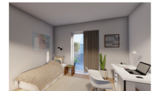
Kind / Arbeiten