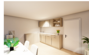
Kochen / Essen