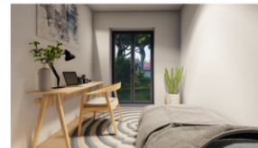
Arbeiten / Gast