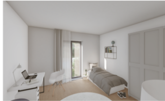
Kind / Gast