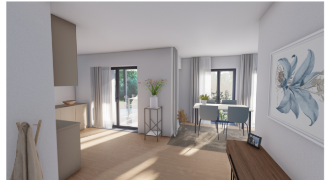
Küche / Essen