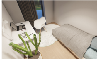
Kind / Gast