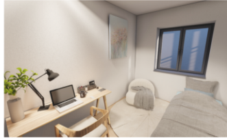
Kind / Gast