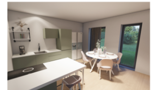
Küche / Essen