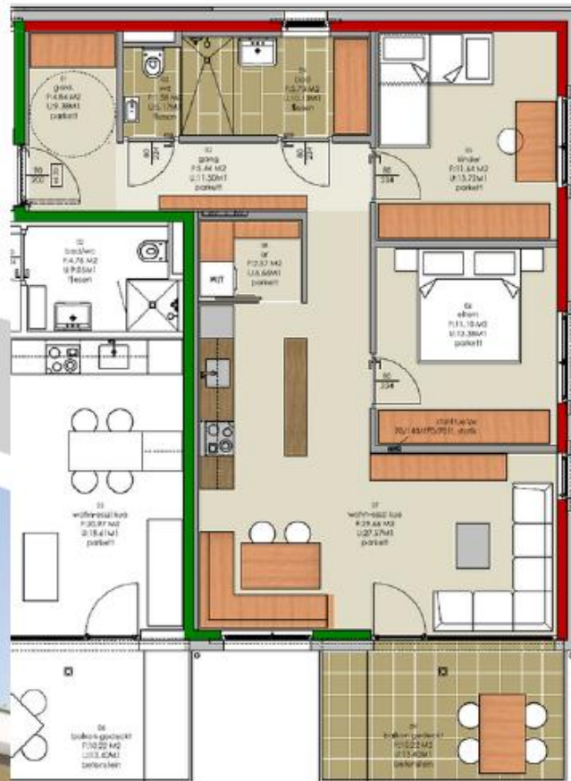
05 2-ZI WOHG. 47,29 M 2