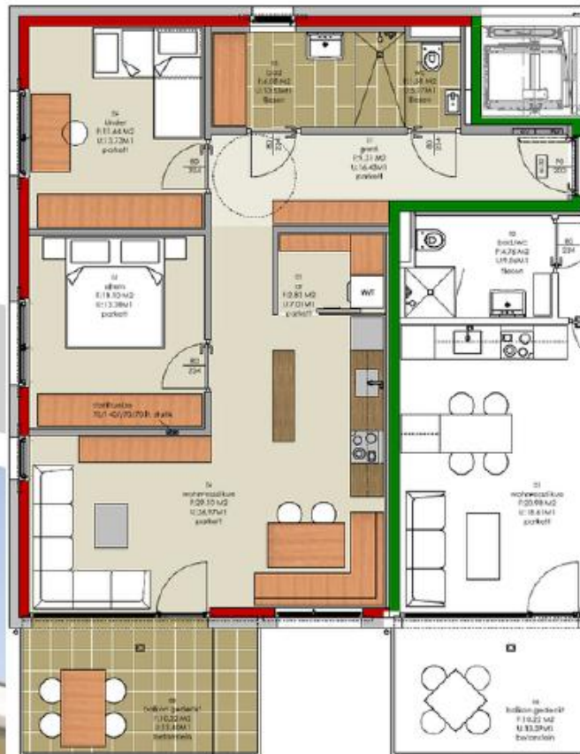
TOP A07 3-ZI WOHN. 71,64 M2