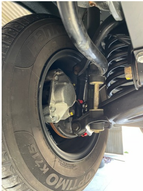
Ansicht Bremse vorne