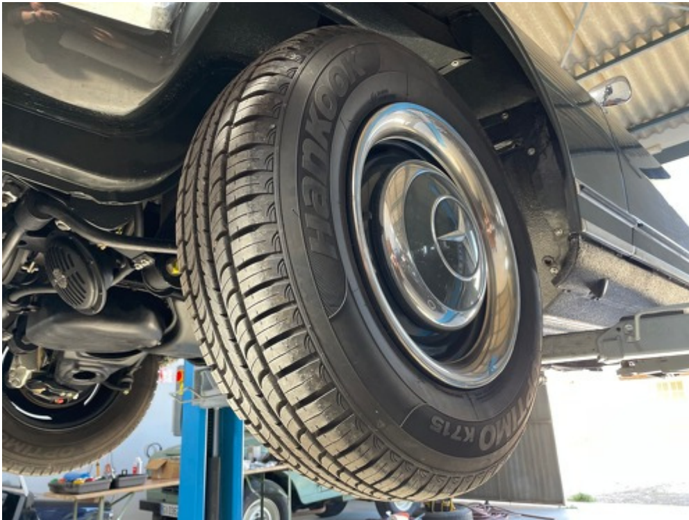
Ansicht Rad mit Reifen