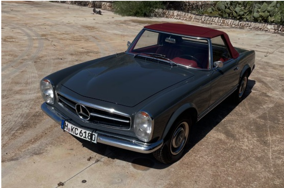
Ansicht vorne links