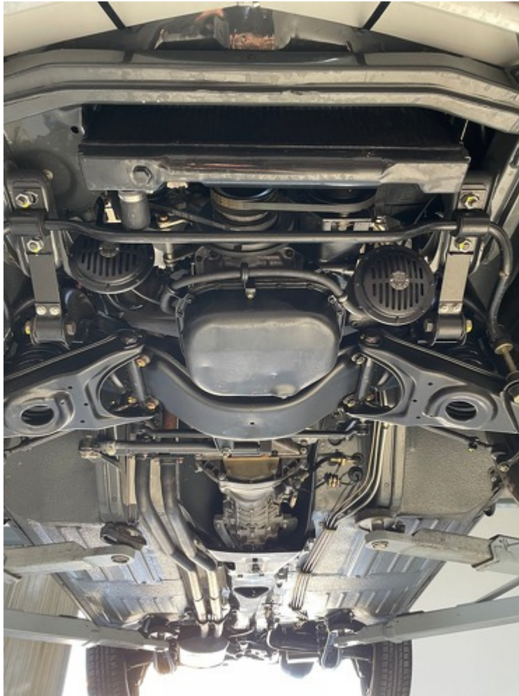
Ansicht Unterboden vorne