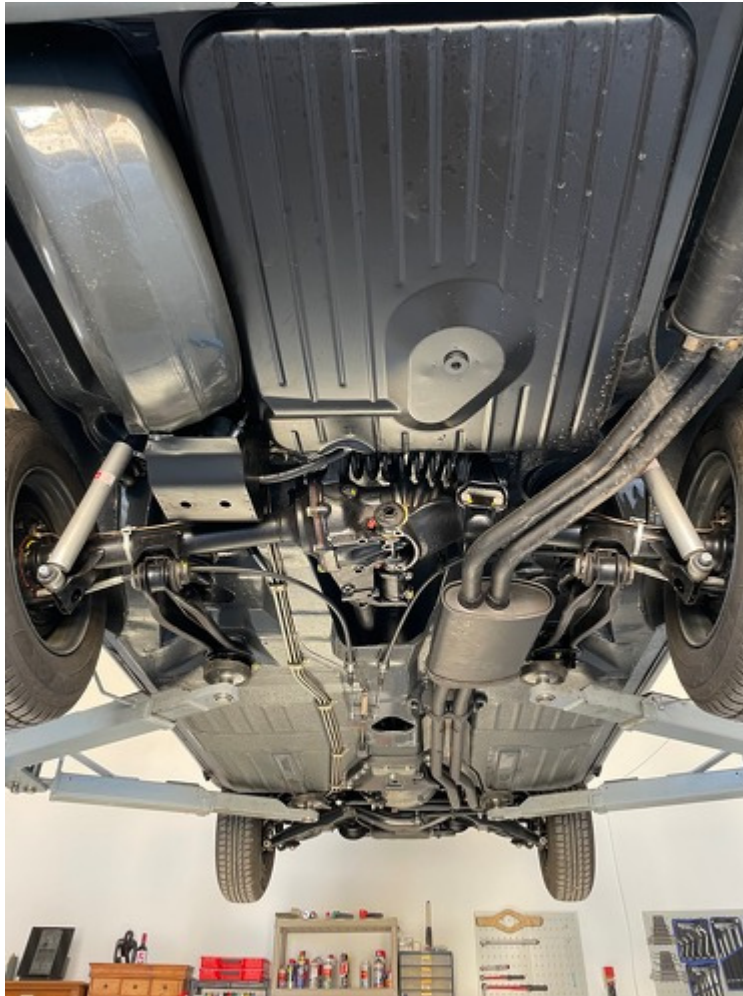
Ansicht Unterboden hinten