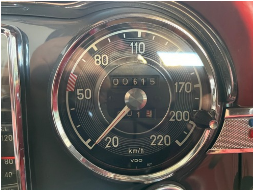
Ansicht Tacho mit 615 Km