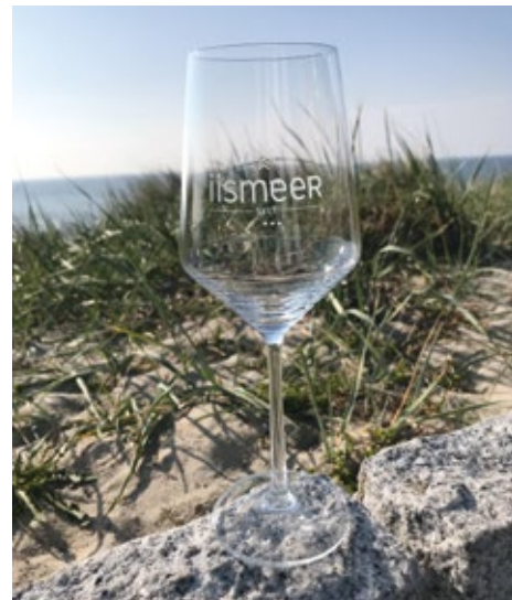
iismeer Weinglas Rot oder Weiß 15,00 €