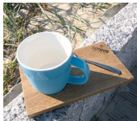
iismeer Kaffeebecher mit iismeer Holzbrett und Löffel Set 49,00 €