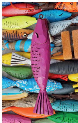
die lustigen iismeer Fische

als Fotografie auf Alu Dibond direkt zu Ihnen nach Hause 39,00 inklusive Versand