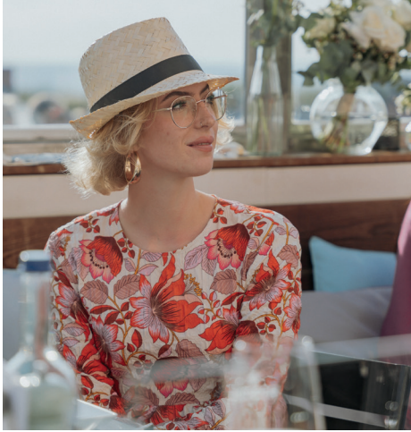
iismeer Sonnenhut / 8,00