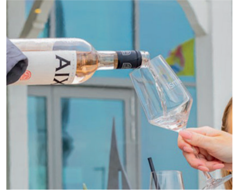
iismeer Weinglas Rot oder Weiß / 15,00

Oversized Look für Damen und Herren in L oder XL / 39,00 Kids Gr. 122 oder Gr. 128 / 29,00