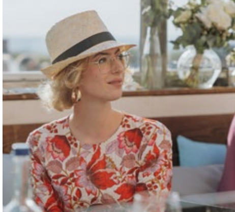
iismeer Sonnenhut / 8,00