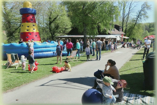
Kinder & Familien