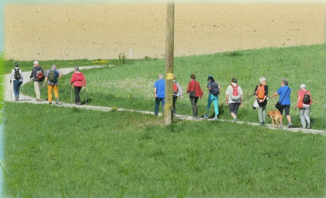
Wandern & Radeln