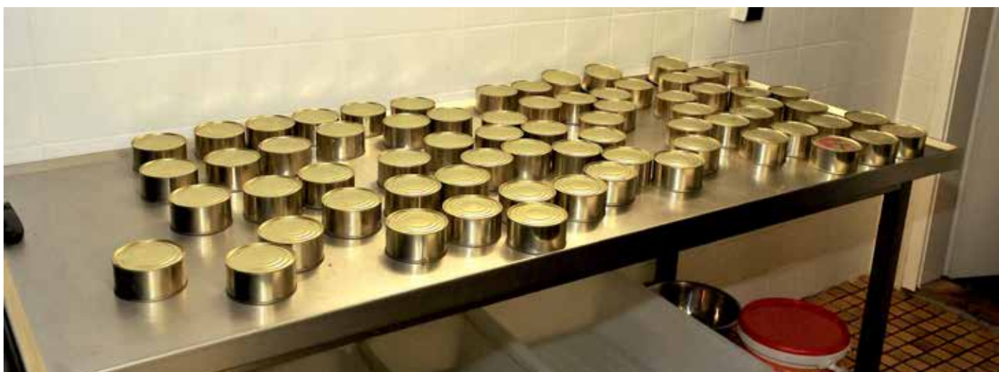
Zu der frischen Wurst kommen noch einmal eine ganze Menge Dosen mit Wurst, die ebenfalls aufgeteilt werden.

Die Rezepte sind so ausgelegt, daß Du die Wurst auch ohne Räuchermöglichkeit reifen lassen kannst.