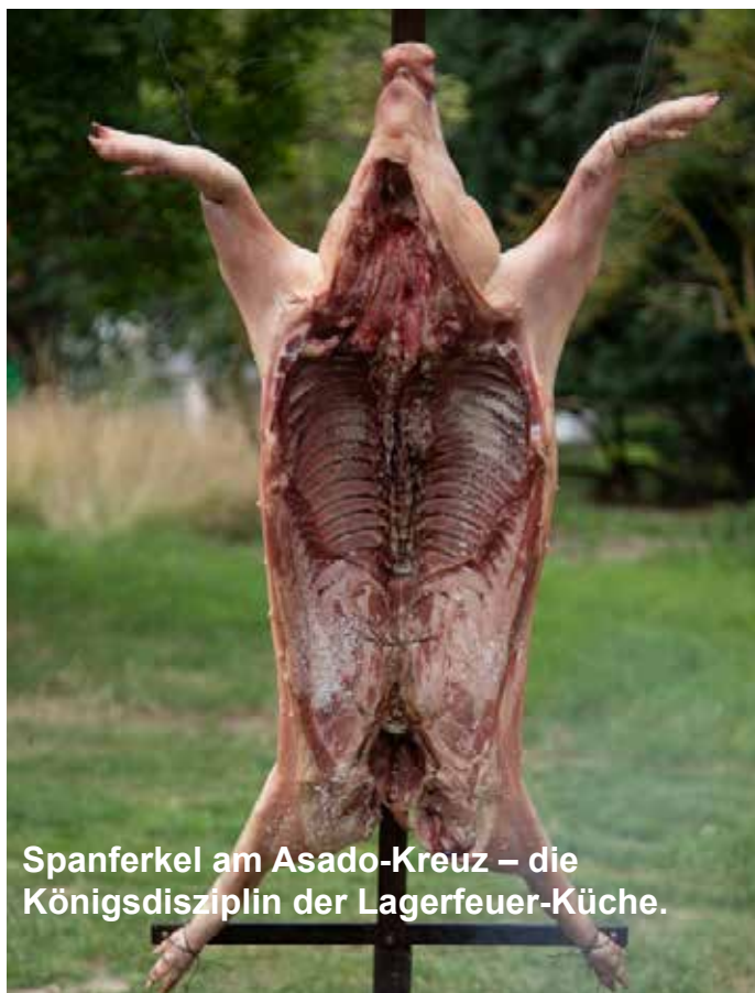
Spanferkel am Asado-Kreuz – die Königsdisziplin der Lagerfeuer-Küche.

Gerne stellen wir für die Kurse auch Gutscheine aus. Da jeder Kunde etwas anders ist, wäre es hilfreich, wenn Du uns kurz dazu anrufst. Sei es daß der Gutscheininhaber noch keinen Termin festmachen kann, sei es daß Du den Gutschein ganz schnell per E-Mail haben mußt oder direkt bei mir abholen willst. Wichtig ist auf jeden Fall eine komplette Anschrift von Dir und dem zu Beschenkenden, mit E-Mail, Postanschrift und Telefonnummer.