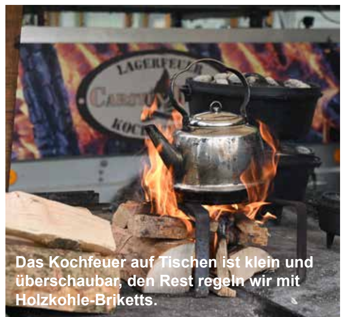
Das Kochfeuer auf Tischen ist klein und überschaubar, den Rest regeln wir mit Holzkohle-Briketts.

Für die Veranstaltung erwarte ich einen Ablaufplan mit den Zeiten für Beginn und Ende sowie der Zahl der Teilnehmer mit Namen und Telefonnummern der Leitenden. Hilfreich ist die Zahl der Damen und Herren sowie Vegetarier, Veganer und Nahrungsmittelunverträglichkeiten, damit ich die Speisenfolge darauf abstimmen kann.