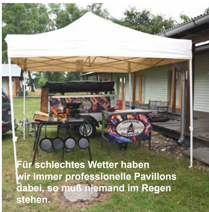
Für schlechtes Wetter haben wir immer professionelle Pavillons dabei, so muß niemand im Regen stehen.

Bedenke bitte, daß nicht jeder in einer größeren Gruppe so viel Interesse am Kochen am Lagerfeuer hat wie Du. Je größer die Gruppe, desto größer die Zahl derer, die eher wenig Elan haben, sich selber etwas zu kochen. Auch für diese Gruppen haben wir ein entsprechendes Programm, wo die Engagierten den Anderen etwas mit zubereiten. Bei einer solchen gemischten Gruppe entsteht sehr schnell Unruhe, wenn sich einige abseits unterhalten. Das ist in unmittelbarer Nähe sehr störend für die Teilnehmer und Ausbilder. Das kann man geschickt umschiffen, indem man eine Sitzgruppe oder Stehtische etwas abseits plaziert.