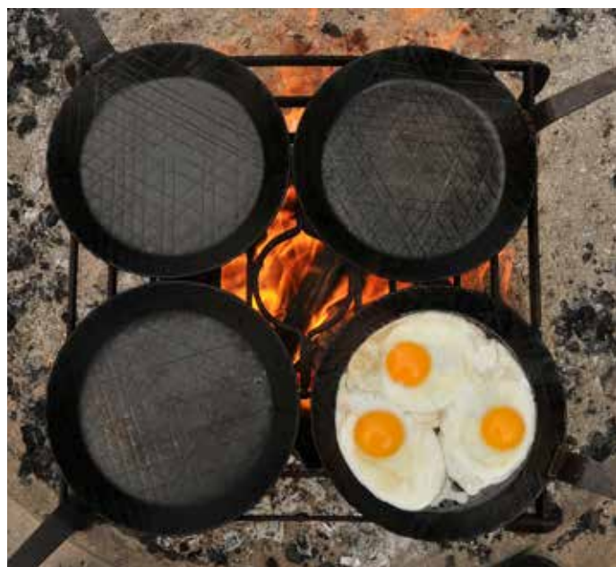
Beim Lagerfeuer-Kochkurs lernst Du schulmäßig leckere Gerichte am Feuer zuzubereiten.