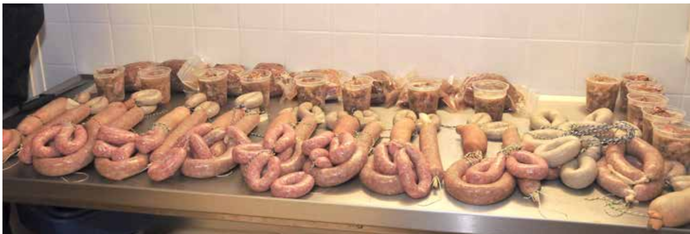
Die Ausbeute eines großen Schlachtekurses mit leckerer frischer Wurst und Sülze.