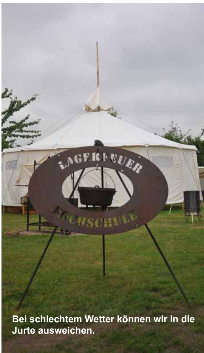
Bei schlechtem Wetter können wir in die Jurte ausweichen.

Sollten die Teilnehmer später den Tag noch am Lagerfeuer mit Gitarre und Liedern ausklingen lassen wollen, siedeln wir zu einer Lagerfeuerstelle um, sofern diese vorhanden ist. So ein Feuer bezeichnen wir dann eher als „Romantik-Feuer“, da es zum Kochen fast nicht geeignet ist.