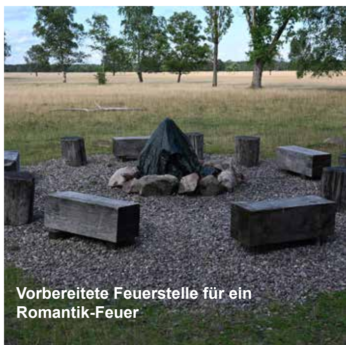
Vorbereitete Feuerstelle für ein Romantik-Feuer