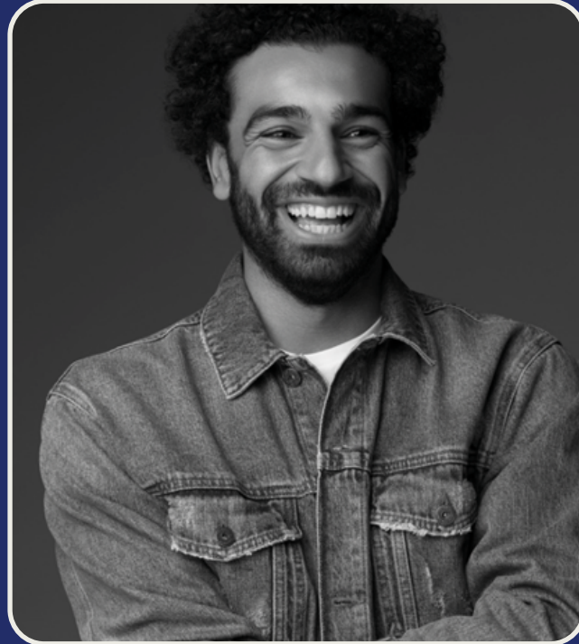
محمد صلاح Mohamed Salah