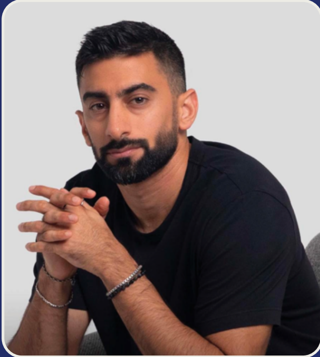
أنس بوكش Anas Bukhash

At Mountain View, we contribute to building happy communities centered around people and human happiness, represented by brand ambassadors from the community to promote that feeling through their stories and interactions with the community, our story started with Mohamed Salah as an ambassador through several a special ad that resonated and communicated his feelings, and we continued the journey with Anas Bokhsh as an ambassador.