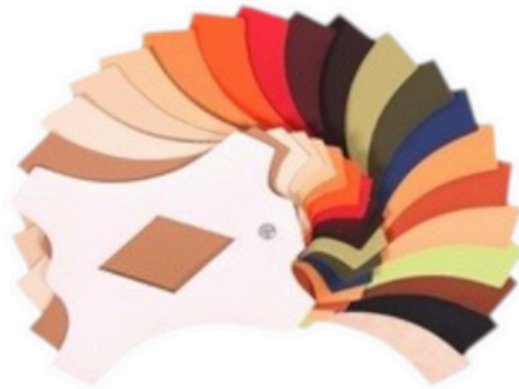
Große Stoffeauswahl auch in schwerentflammbarer Ausführung erhältlich