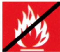
schwerentflammbar nach B 1 (DIN 4102, Teil 1)