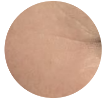
Nachher: Sichtbare Hautverjüngung