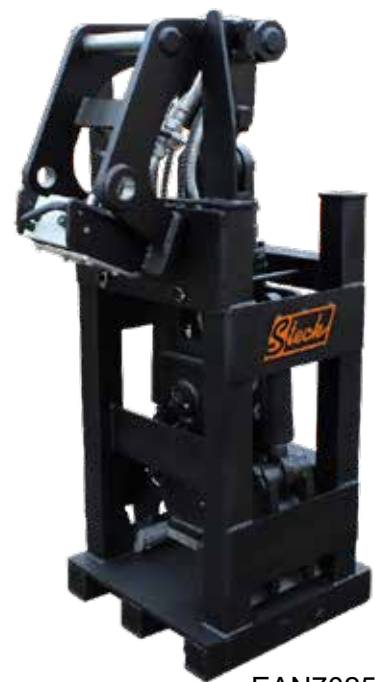
EAN70255 SZ5 Transportbox