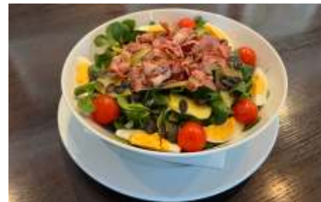
Vogersalat mit Speck, Ei, Kartoffeln