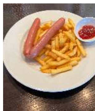
Frankfurter mit Pommes