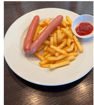
Frankfurter mit Pommes