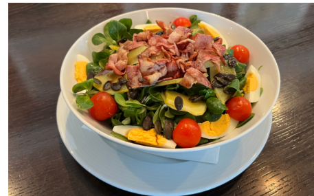
Vogersalat mit Speck, Ei, Kartoffeln