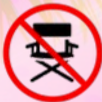
Campingstühle & Campingzubehör