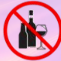
PET-, ALU- & Glasbehälter