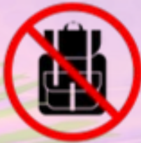
Rucksäcke & Taschen größer als DIN A4